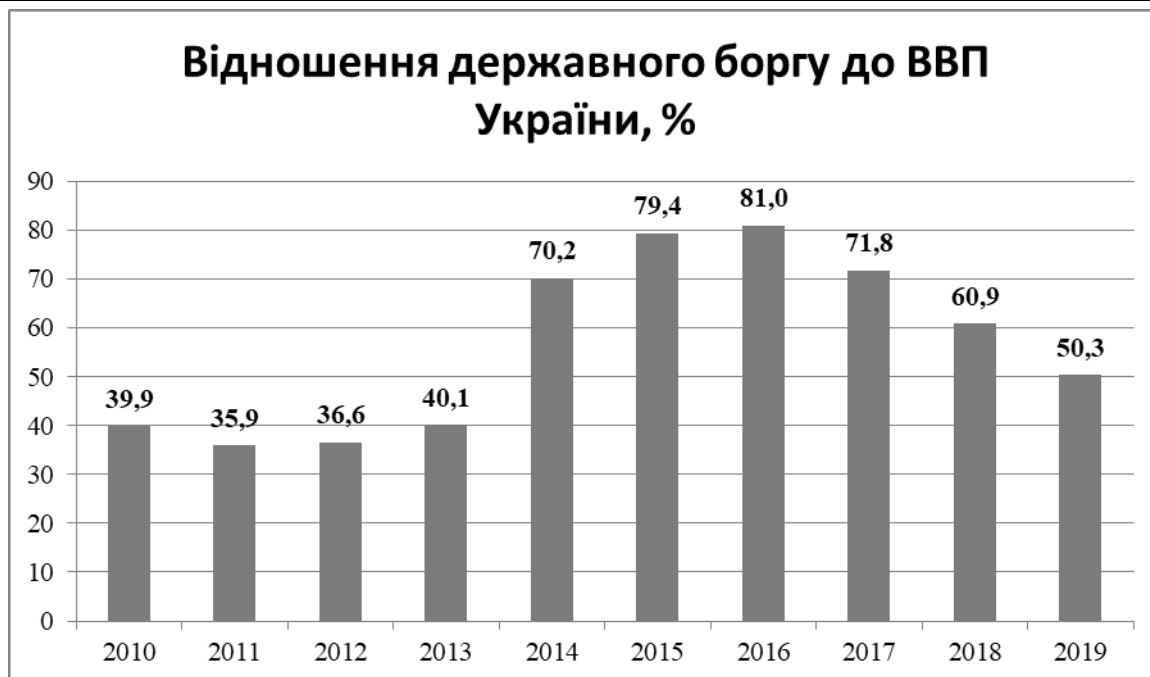
Рис. 2. Відношення державного боргу України до ВВП країн [створено автором на основі даних [7]]

Аналізуючи динаміку державного боргу України за період 2010-2019 рр., слід зазначити, що: