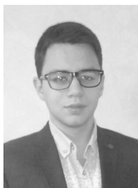
студент, Одеський національний університет імені І.І. Мечникова