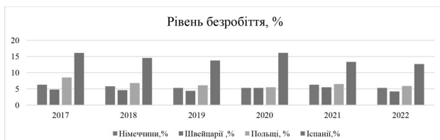
Рис. 2. Рівень безробіття країн ЄС в період 2017-2022 рр, % [4-6, 8, 9]

Але принаймні досі ця форма технологічних змін не мала руйнівного впливу на німецький ринок праці. Однак через нові форми зайнятості, які не охоплюються стандартними установами, цифровізація також загрожує стійкості системи соціального забезпечення, яка вже зазнає тиску демографічних змін [5].