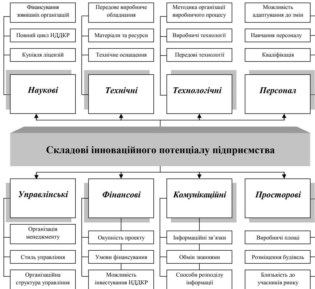
Рис. 1. Складові внутрішнього інноваційного потенціалу для забезпечення конкурентоспроможності підприємства [складено авторами на основі [3, с. 140-148]]