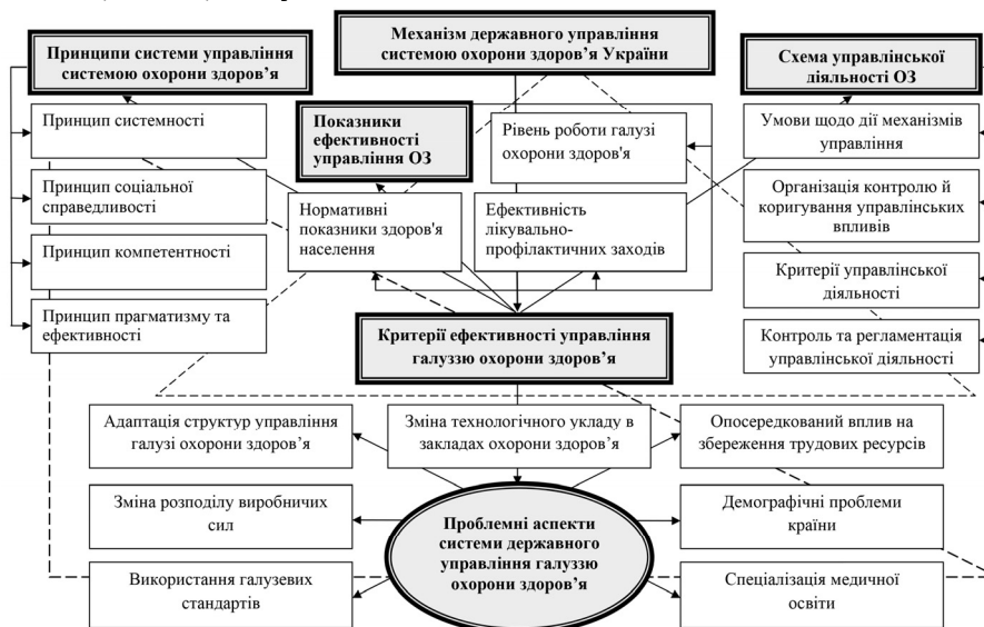
Рис. 1. Концепція механізму державного управління системою охорони здоров'я України

Розробляючи механізм державного регулювання системою охорони здоров'я, необхідно керуватися сучасними викликами та набутим досвідом. Теоретико-методологічною та методичною базою таких досліджень має бути насамперед діалектичний метод пізнання, враховуючи принципи системності та послідовності у пізнанні об'єктивних законів суспільного розвитку, фундаментальні та прикладні роботи й розробки провідних вітчизняних і закордонних фахівців із проблем формування основ та функціонування механізму державного регулювання галузі охорони здоров'я з огляду на процеси глобалізації (рис. 1).