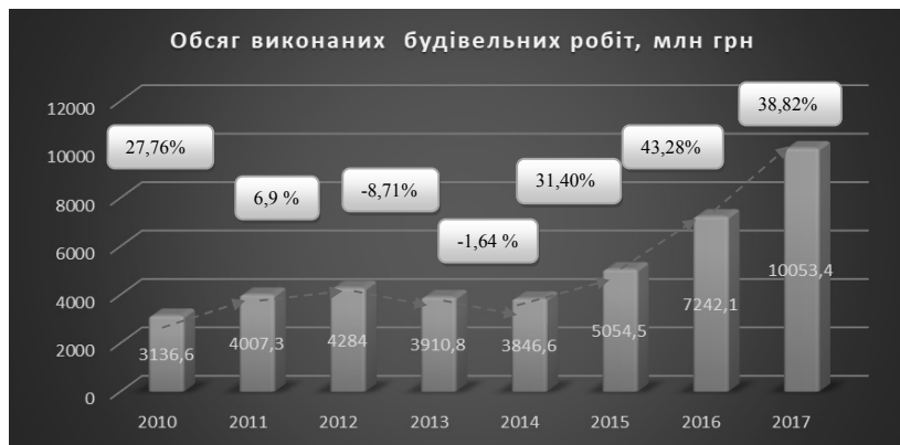
Рис. 4. Динаміка аналізу обсягу виконаних будівельних робіт Харківського регіону [розроблено авторами за джерелом [5]]

Щодо динамічних змін обсягу будівельних робіт по Харківському регіоні, то слід відмітити більш глибоке падіння за період 2013-14 рр. та більш стрімке зростання за період 2015-16 рр, аніж в цілому по Україні.