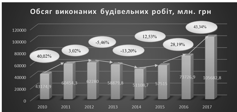
Рис. 2. Динаміка аналізу обсягу будівельних робіт [розроблено авторами за джерелом [4]]