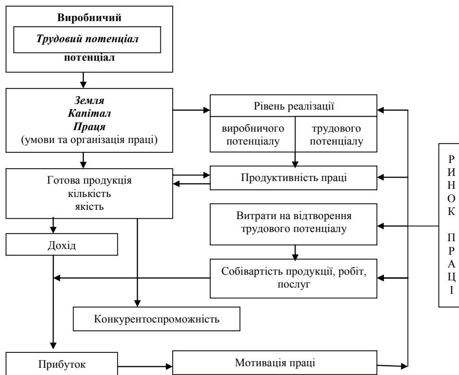
Рис. 3. Взаємозв'язок виробничого потенціалу з конкурентоспроможністю фермерського господарства через відтворення трудового потенціалу [власна розробка автора]