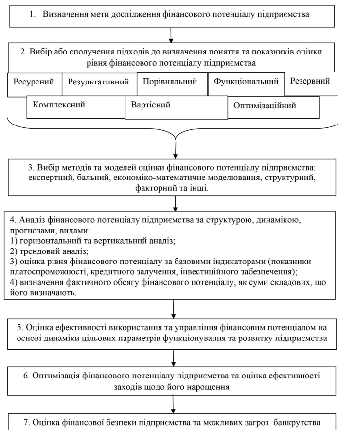
Рис. 1. Зміст та послідовність оцінки фінансового потенціалу підприємства [сформовано авторами за [6, 13]]

Процес оцінювання фінансового потенціалу підприємства пропонуємо здійснювати з використанням наступної методики (рис. 1). За такої умови методика оцінювання фінансового потенціалу повинна базуватися не на оцінюванні існуючих та прогнозованих фінансових результатів підприємства та суми залучених кредитів, а на оцінюванні фінансових результатів від втілення в життя всіх видів планів підприємства (інвестиційного, виробничого, маркетингового, плану перепідготовки кадрів тощо).