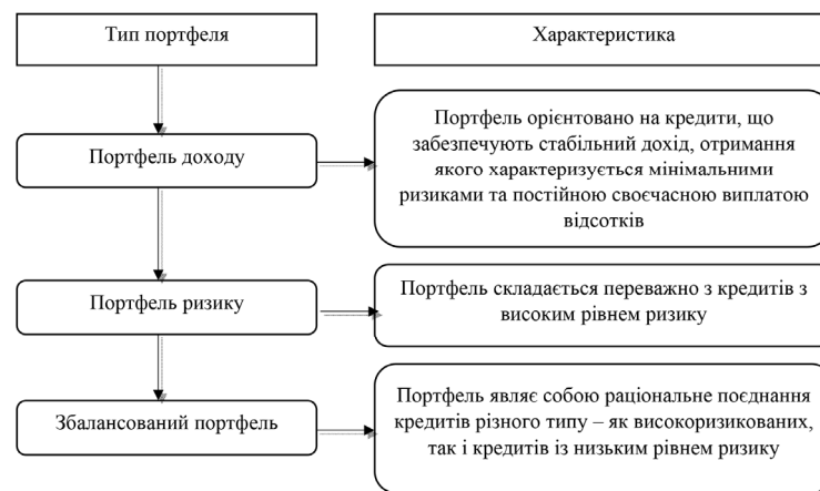
Рис. 1. Основні типи кредитного портфеля

Значимо, що ризиковий портфель характеризується підвищеним рівнем прибутковості у високому рівні ризику, тоді як у портфелі доходу рівень прибутку є нижчим, однак і кредитні ризики є мінімальними. Збалансований кредитний портфель являє собою сукупність банківських кредитів та має структуру і фінансові характеристики, що знаходяться в межах вибору найбільш ефективного вирішення поєднання ризику і прибутковості [7].