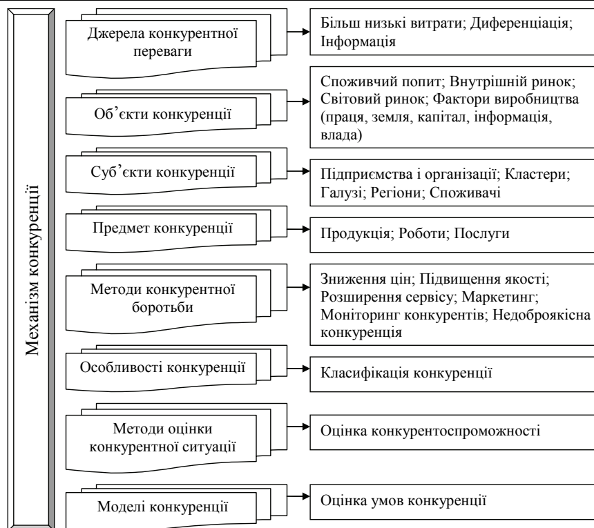
Рис. 1. Механізм конкуренції [6]

Таким чином, при визначенні конкуренції використовується декілька підходів: