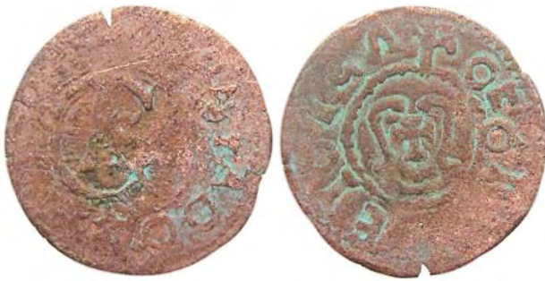
Рис. 383 Фальшивий шведський солід Густава II Адольфа Ваза (1611–1632), прототип карбування монетного двору Риги. Діаметр: 15,5 мм; вага: 0,46 г. [...] VST ADO [...] OEOI [...] OEOI5A Приватна колекція (Вишгород)