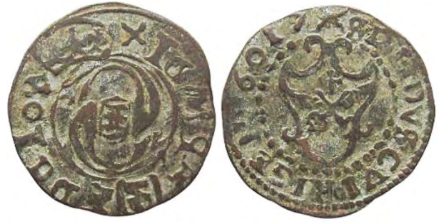
Рис. 371 Фальшивий шведський солід 1607 р. Сигізмунда III Ваза (1587–1632) із фантазійною позначкою «6017», прототип карбування монетного двору Риги. XIGN [...] ] 3 DG IOR [...] ] SDLIDVS GVI [...] ] RIGEN 6017 Місце знахідки: Вінницька обл., Жмеринський р-н, с. Лука-Барська. Приватна колекція (Вишгород)