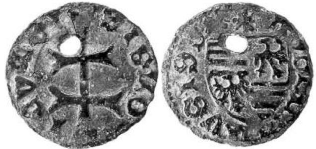
Рис. 332 Фальшивий угорський денарій Сигізмунда Люксембурга (1387–1437) карбування 1390–1427 рр. Діаметр: 12,61 мм; вага: 0,43 г. [...] IGLO ICVM [...] LVSI9

Науці відомі підробки денаріїв Сигізмунда Люксембурга. Зважаючи на склад сплаву металу поверхні фальшивого денарія (рис. 332), можна зробити висновок про застосування технології лудіння [180]. На фото зі збільшенням у розрізі отвору монети можна побачити шари, що визначають основу підробки та покриття (рис. 333).