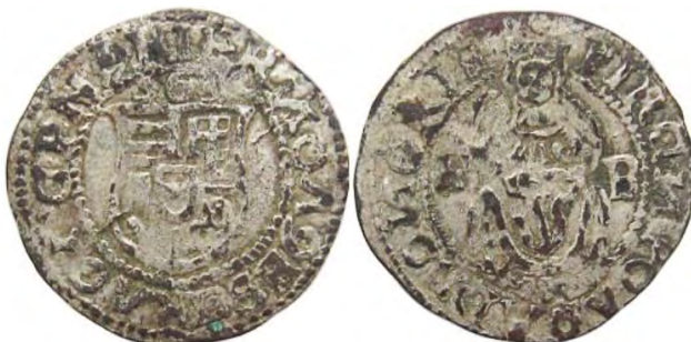
Рис. 344 Фальшивий угорський денарій 1563 р. Фердинанда I Габсбурга (1526–1564). Діаметр: 17 мм; вага: 0,53 г. RHOA9ESGRAOIGRN 563 PTRGI POA * ADROIGRIE Приватна колекція (Вишгород)

Восени 1994 р. в Чернівцях на вул. Сибірській (поселення Стара Жучка) знайдено 164 монети. Це друга частина скарбу після першої знахідки монет у цьому місці в 1970-ті рр. кількістю 86 монет. Серед солідів Речі Посполитої дослідники ідентифікували три угорських денарії Фердинанда I Габсбурга (1526–1564) із позначкою «1531», один з яких виявився фальшивим. У складі того самого комплексу крім двох османських акче, що дуже погано збереглися, виявлено також монету зі срібним покриттям [184].