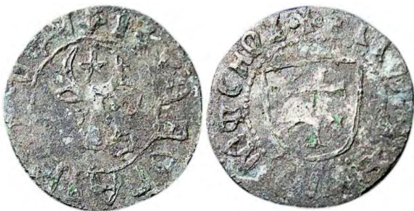
Рис. 402 Фальшивий молдавський грош Богдана III (1504–1517). [...] БОГД [...] [194] [...] МФСНОІ+

Серед кустарних підробок молдавських монет нам відомий екземпляр, який наслідує гроші Богдана III (1504–1517) (рис. 402).