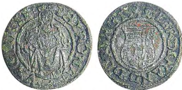
Рис. 343 Фальшивий угорський денарій 1559 р. Фердинанда I Габсбурга (1526–1564). FERDINAND D G R VNNG 1554 PATRONA * * * VNGARIE Місце знахідки: Рівненська обл. Гоцанський р-н