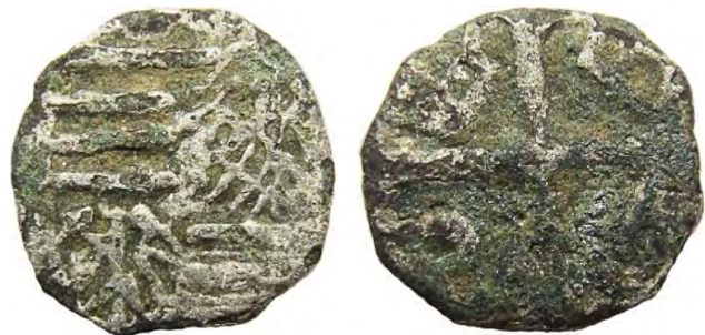
Рис. 330 Фальшивий угорський парвус Сигізмунда Люксембурга (1387–1437). Діаметр: 7 мм; вага: 0,3 г. Місце знахідки: Закарпатська обл., Береговський р-н, м. Берегове. Приватна колекція (Вишгород)

Найдрібнішою срібною монетою Сигізмунда Люксембурга був парвус. У грошовому обігу українських історичних регіонів знахідки парвусів переважають у Закарпатті, де також місцеві краєзнавці виявили кустарну підробку монети цього типу (рис. 330).