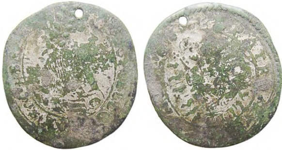
Рис. 358 Фальшиві 15 крейцерів Леопольда I Габсбурга (1658–1705), прототип карбування монетного двору м. Кремниця. Діаметр: 28x30 мм; вага: 5,44 г. [...] POL D D G [...] A G H RE [...] PATR [...] NA [...] Приватна колекція (Вишгород)

Також зазначимо, що всі вивчені нами підробки монет імператора Леопольда I Габсбурга виготовлено на високому технічному рівні. Наприкінці XVII ст. з упровадженням на державних монетних дворах прогресивних технологій підробки низького рівня виконання з примітивним рисунком практично зникають. Кустарним фальшивомонетникам дедалі складніше подолати нові ступені захисту монет, доступні після запровадження машинного виробництва.