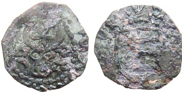
Рис. 401 Фальшивий грош Стефана III чел Маре (тип із хрестом на щиті). Діаметр: 13 мм; вага: 0,52 г. Місце знахідки: Чернівецька обл., Кельменецький р-н. Приватна колекція (Вишгород)

Серед нумізматів побутує думка, ґрунтована на монетних знахідках, що на території Молдавського князівства під час правління Стефана IV Молодого (1517–1527) підроблювали литовські півгроші короля Польщі і Великого князя Литовського Сигізмунда I Старого (1506–1548). Певно тому уряди Польщі та Литви ухвалили рішення про закриття кордонів і торговельних зв'язків із князівством. Знахідка підробленого литовського півгроша поблизу м. Хотина свідчить про можливе місце локалізації фальшивих монет у фортеці [194]. Підробки півгрошів Сигізмунда I Старого містилися й у скарбах, виявлених у Чернівецькій області (селах Денисівка, Романківці, Жилівка). Ці факти – непряме підтвердження наших припущень щодо підроблення півгрошів на території Молдавського князівства [107, с. 120].