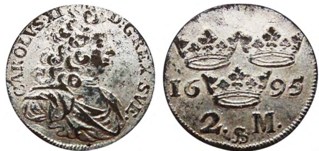
Рис. 397 Фальшиві шведські 2 марки 1695 р. Карла XI (1660–1697). Вага: 7,78 г. CAROLVS-XI D:G:REX-SVE- 16-95 / 2. S M. Місце знахідки: Латвія, Рига

Наприкінці XVII ст. шведська монета втрачає свій вплив на грошовому ринку Східної Європи, а відтак її перестають надто широко підробляти.