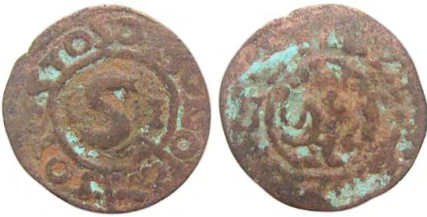
Рис. 363 Фальшивий шведський солід Сигізмунда III Ваза (1587–1632), прототип карбування монетного двору Риги. Діаметр: 14 мм; вага: 0,44 г. SOIO [...] SOIO SIOSO I-S-I [...] Приватна колекція (Вишгород)