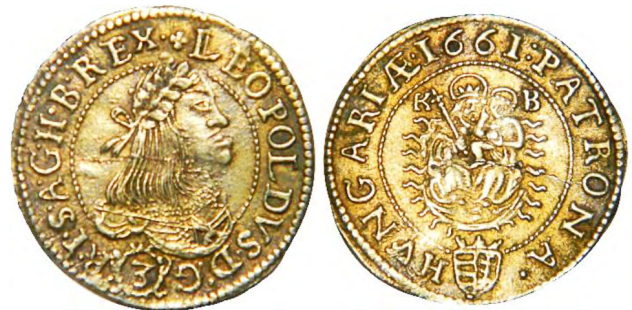
Рис. 359 Позолочені 3 крейцери 1661 р. угорського карбування монетного двору Леопольда I Габсбурга (1658–1705). +LEOPOLDVS-D:G (3) R-I-S-A-G-H-B-REX :PATRONA·HVNGARIAE 1661

Цікавий у фокусі фальшивомонетництва екземпляр виявлено в скарбі у Вінницькій області. Серед голландських левендаальдерів і дукатів (один левендаальдер провінції Голландія також мав на полі надкарбування монетного двору Мальтійського ордену), іспанських реалів різного номіналу, фракцій французьких франків, ортів карбування Гданська, бешликів Кримського ханства, гросо Рагузької республіки, монет Священної Римської імперії німецької нації та Речі Посполитої варта уваги угорська монета 3 крейцери Леопольда I Габсбурга 1661 р., покрита шаром золота (рис. 359). Позолочену монету виявлено в складі комплексу із золотими дукатами, певно, у давнину її могли прийняти за дукат. За стилістикою срібні та золоті монети Леопольда Габсбурга схожі, на аверсі містять зображення портрета монарха, на реверсі – герб, що емітує монету землі. Можна припустити, що цей екземпляр є підробкою золотої монети, але його вага лише 1,9 г, що суттєво нижча, ніж вага золотих дукатів. Зважаючи на те що багато позолочених монет державного зразка, укритих шаром жовтого металу на поверхні, виготовлялися як прикраси, очевидно, той, хто приховав цей скарб, помістив описаний екземпляр не як золоту, а як срібну монету.