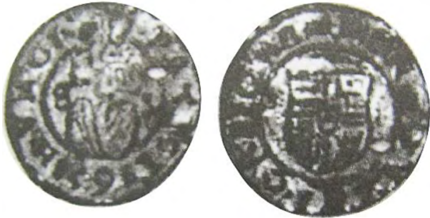
Рис. 342 Фальшивий угорський денарій 1563 р. Фердинанда I Габсбурга (1526–1564). [...] PATRON6 VNG [...] / [...] - B www.forum.violity.com

Серед фальсифікатів денаріїв імператора Священної Римської імперії Фердинанда I Габсбурга (король Угорщини та Богемії 1526–1564 рр.) нам також відомі підробки, що імітують угорські денарії 1541, 1545, 1550, 1554, 1559 (рис. 343) та 1563 рр. карбування (рис. 344).