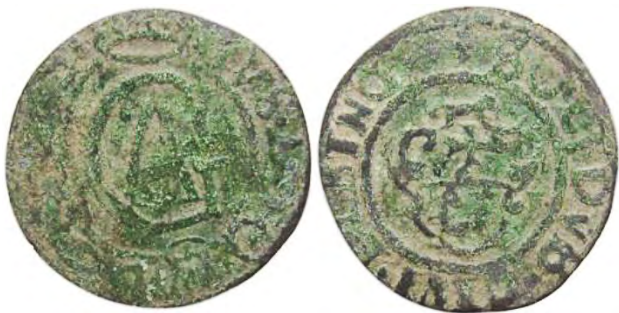
Рис. 385 Фальшивий шведський солід Густава II Адольфа Ваза (1611–1632), прототип карбування монетного двору Ельблонга. Діаметр: 16,5 мм; вага: 0,63 г. GVS-ADO [...] SOLIDVS-CIVI-ELBING [...] Приватна колекція (Вишгород)

Схожість стилістики гербів Риги та Ельблонга зумовила складність встановлення прототипу підробки через їхнє спотворене відтворення фальшивомонетниками та часто нечитабельні легенди. Але ми вважаємо, що кустарних підробок солідів монетного двору Риги значно більше, ніж