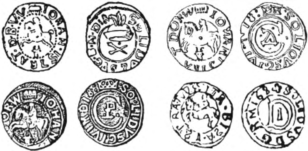
Рис. 403 Молдавські соліди з ім'ям Євстратія Дабіжі (1661–1665)

і реформатор монетної справи Тит Лівій Боратині (1617–1681) – «батько» боратинок. Докладніше про це йдеться в розділі 4, присвяченому Польщі та Речі Посполитій (див. Криміналіст. вісн. 2024. № 1(41). С. 96–137).