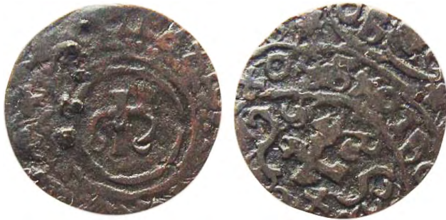
Рис. 395 Фальшивий шведський солід Христини I (1632–1654), прототип карбування монетного двору Риги. Діаметр: 16,1 мм; вага: 0,7 г. [...] EX [...] [...] SOLI [...] XO /// [...] XO [...] Приватна колекція (Вишгород)

монети державного карбування, і навпаки – фальшиві монети та імітації розміщують у каталогах як офіційні.