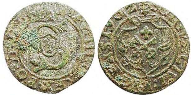
Рис. 361 Фальшивий шведський солід 1602 р. Сигізмунда III Ваза (1587–1632) із фантазійним позначенням року «1902». Вага: 1,03 г. SIG-III-D [...] REX-PO:D:LI SOIGVS:GIII:REG [...] IS 1902 Місце знахідки: Білорусь, Брестська обл. www.belklad.by

На монетному дворі в Ризі карбували соліди і трояки від імені короля Речі Посполитої Стефана Баторія (1576–1586). Найбільш підроблюваним типом ризьких монет періоду правління Стефана Баторія вважають трояки, детально описані в розділі 4, у якому йдеться про фальшиві монети Польщі та Речі Посполитої (див. Криміналіст. вісн. 2024. № 1(41). С. 96–137). За короля Речі Посполитої Сигізмунда III Ваза (1587–1632), який із 1592 по 1599 рр. ще й король Швеції, у Ризі налагодили випуск шелягів, які також стали прототипом для масового фальшування (рис. 361–364).