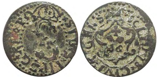
Рис. 366 Фальшивий шведський солід Сигізмунда III Ваза (1587–1632), прототип карбування монетного двору Риги. xSIGISxI-I-IxD:G R [...] PO SOLIDVSxCIVIXRIGENS Місце знахідки: Вінницька обл., Жмеринський р-н, с. Лука-Барська. Приватна колекція (Вишгород)

Варту уваги знахідку виявив місцевий житель під час сільськогосподарських робіт поблизу с. Лука-Барська (Жмеринський район Вінницької області). Величезний грошовий скарб, окрім безлічі ортів, шостаків і грошів, налічував понад п'ять тисяч солідів різних монетних дворів Речі Посполитої, серед яких переважали екземпляри карбування Риги до 1605 р. Ми змогли визначити 15 монет кустарного підроблення. Цікавим убачається те, що вони виконані схожим способом – це може свідчити про локальне походження фальсифікатів. Також привертають увагу фальсифікати-гібриди, під час виробництва яких використовували як прототипи соліди шведські Сигізмунда III Ваза, а також польські та литовські (рис. 365–379).