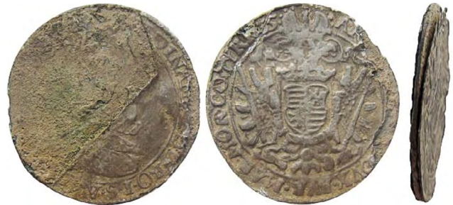
Рис. 345 Фальшивий угорський талер Фердинанда I Габсбурга (1526–1564) із позначкою [...]35. Діаметр: 47 мм; вага: 21,4 г. [...] DINAND [...] D G RO-I-S-A [...] AR [...] DVX-AVR-MAR-MORCOTIR. [...] 35: Місце знахідки: Черкаська обл., Уманський р-н, с. Ятранівка www.forum.violity.com

Серед монет Фердинанда I нам також відомий екземпляр фальшивого талера, виготовлений методом паяння срібних пластин (рис. 345) [134].