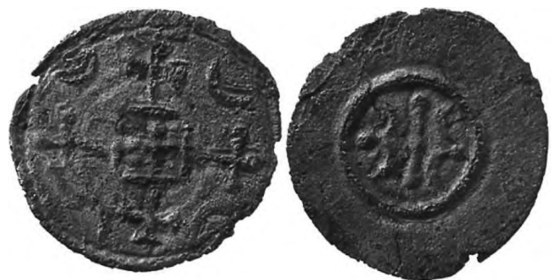
Рис. 327 Фальшивий анонімний денарій XI–XII ст. Угорщина. Діаметр: 11,5×12,3 мм; вага: 0,253 г

У XIII – на початку XIV ст. на території Угорщини та Словаччини австрійські пфеніги набули великої популярності, що й зумовило появу фальсифікатів. Разом з оригінальними срібними пфенігами неподалік с. Болдог (район Сенець, Братиславський край, Словаччина) знайдено й підробки пфенігів Відня, оригінальні прототиби яких карбувалися понад століття – у 1251–1358 рр. Покриті срібним шаром мідні заготовки, що наслідують віденські пфеніги, певно, виготовляли в Угорщині