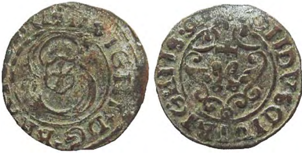
Рис. 368 Фальшивий шведський солід 1599 р. Сигізмунда III Ваза (1587–1632), прототип карбування монетного двору Риги. SIG IIIxDGxREX [...] ] OIIDVS GIVI RIGNIIS-9 [...] ] Місце знахідки: Вінницька обл., Жмеринський р-н, с. Лука-Барська. Приватна колекція (Вишгород)