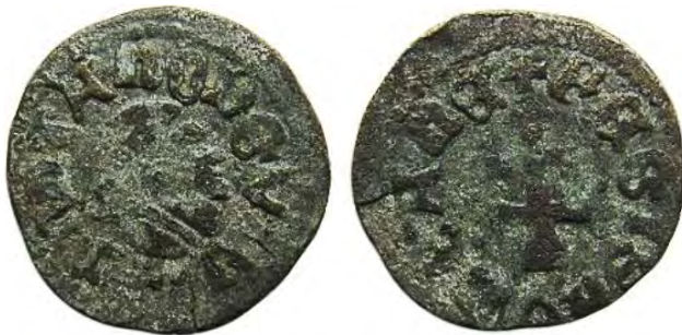
Рис. 328 Фальшивий угорський денарій Лайоша I Великого (1342–1382). Діаметр: 16 мм; вага: 0,67 г. [...] NETA [...] VICI +REGIS VNGARIE Приватна колекція (Вишгород)

Фальшивий денарій Лайоша I Великого (рис. 328) випадково виявили місцеві жителі Закарпатської області. Його поверхня, установлено методом рентгенофлуоресцентного аналізу, покрита товстим шаром олова (14,1 %), що свідчить про нанесення фальсифікаторами покриття для надання монеті кольору дорогоцінного металу.