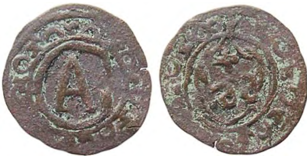
Рис. 384 Фальшивий шведський солід Густава II Адольфа Ваза (1611–1632), прототип карбування монетного двору Риги. Діаметр: 15/16 мм; вага: 0,76 г. [...] OIO [...] [...] IOIO [...] Приватна колекція (Вишгород)