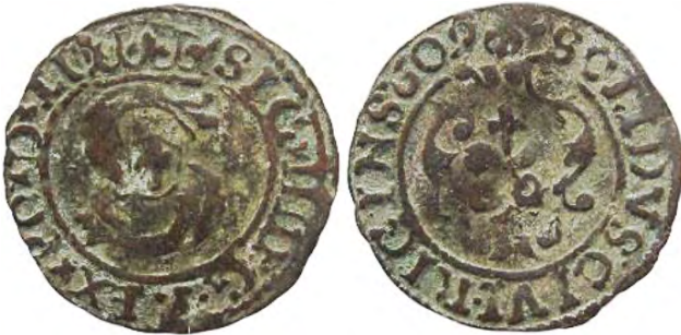
Рис. 369 Фальшивий шведський солід 1609 р. Сигізмунда III Ваза (1587–1632), прототип карбування монетного двору Риги. SIG III D:G-REXxPOxDxLI SOLIDVS CIVI RIGINS-609 Місце знахідки: Вінницька обл., Жмеринський р-н, с. Лука-Барська. Приватна колекція (Вишгород)