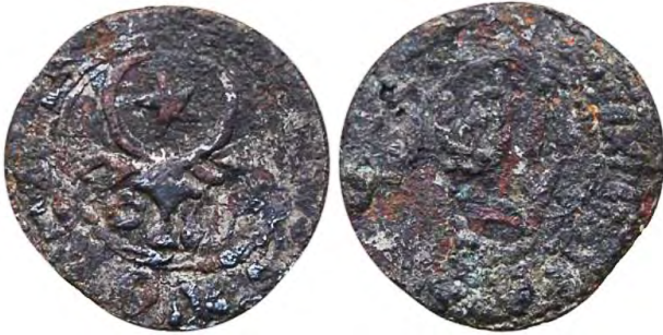
Рис. 398 Фальшивий молдавський грош Петра I Мушата (1375–1391). Приватна колекція Олександра Литвинчука (Рівне)

Карбування молдавських державних монет починається за правління господаря Молдови Петра I Мушата (Мушатіна) (1375–1391). Найбільш ранні якісні молдавські гроші зазнали підроблення майже одразу. Зокрема, фальшиві мідні гроші (рис. 398–399), імітація легенди на яких не збереглася, з огляду на стилістику могли карбуватися за часів правління господаря Петра Мушата або його племінника Олександра чел Буна (1400–1432).