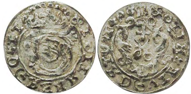
Рис. 372 Фальшивий шведський солід 1598 р. Сигізмунда III Ваза (1587–1632), прототип карбування монетного двору Риги. SIG II RXDEEG DxII SOLIXxEIVG D R IVxIx P8 Місце знахідки: Вінницька обл., Жмеринський р-н, с. Лука-Барська. Приватна колекція (Вишгород)