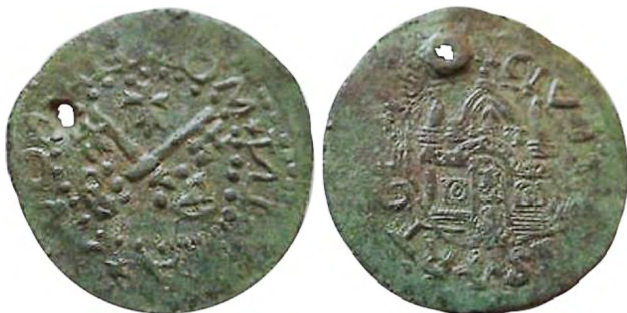
Рис. 360 Фальшивий шилінг карбування монетного двору вільного міста Риги. [...] ON*NA [...] VO [...] RIG [...] CIVI [...] P RTO [...] www.ebay.com

Останній магістр Лівонського ордену Готгард фон Кеттлер (1559–1561) 28 листопада 1561 р. визнав себе васалом короля Польського та Великого князівства Литовського Сигізмунда II Августа (1548–1572). Жителі Риги з таким рішенням не погодилися, і протягом ще двох десятиліть місто мало статус вільного з політичною та економічною незалежністю. У вільному місті шилінги карбували з 1563 по 1579 рр., відомі монети й без позначення року [129, с. 38–67]. У знахідках Прибалтики були екземпляри фальсифікатів шилінгів вільного міста Риги, художній рівень виконання яких більш низький (рис. 360). Зважаючи на те що на полі фальсифікату немає дати, цей тип шилінгів підробляли без позначення року.