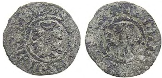
Рис. 329 Фальшивий угорський денарій королеви Марії (1382–1387). [...] M [...] M [...] M Приватна колекція (Київ)

грошового обігу цієї області в XIV–XVI ст. і незрідка є прототипом для підроблення.