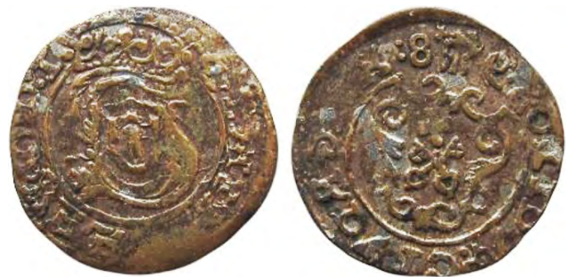
Рис. 367 Фальшивий шведський солід 1589 р. Сигізмунда III Ваза (1587–1632), прототип карбування монетного двору Риги. [...] D:I SOLIDVS CIV:GSG [...] X :8-e: Місце знахідки: Вінницька обл., Жмеринський р-н, с. Лука-Барська. Приватна колекція (Вишгород)

Підробки шведських солідів Сигізмунда III Ваза з огляду на тривалий період виробництва оригінальних монет, а також завдяки великій кількості їх типів набули неймовірного розмаїття. Серед вивчених нами підробок зі скарбу, знайденого поблизу с. Лука Барська, спостерігаються всі особливості фальшивих монет того часу: