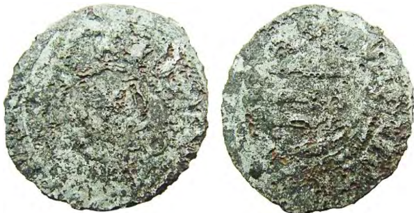
Рис. 399 Фальшивий молдавський грош Петра I Мушата (1375–1391). Діаметр: 18 мм; вага: 0,72 г. Місце знахідки: Чернівецька обл. Хотинський р-н, с. Рухотин. Приватна колекція (Вишгород)

Фальшивий грош, стилістично схожий на монети Петра Мушата та Олександра чел Буна, знайдено на околицях с. Рухотин, Хотинського району Чернівецької області (рис. 399). На аверсі в центрі в обідку збереглося зображення бика із зіркою між рогами, а також нечитабельні фрагменти легенди. На реверсі чітко видно герб із прямокутним верхом, оздоблений лініями, а також нечитабельні фрагменти легенди. Дослідження з використанням точної вимірювальної апаратури (рентгенофлуоресцентний аналіз) показали наявність товстого шару олова на поверхні, що свідчить про застосування техніки лудіння.