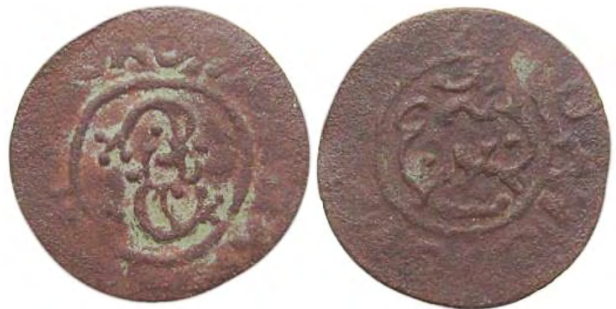
Рис. 362 Фальшивий шведський солід Сигізмунда III Ваза (1587–1632), прототип карбування монетного двору Риги. Діаметр: 15 мм; вага: 0,65 г. [...] OAN [...] Приватна колекція (Вишгород)