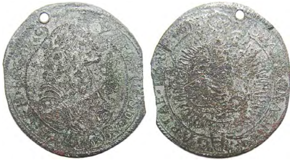
Рис. 357 Фальшиві 15 крейцерів 1676 р. Леопольда I Габсбурга (1658–1705), прототип карбування монетного двору м. Нагібанія. Діаметр: 31 мм; вага: 4,89 г. [...] D D GR (XV) A-G-H [...] PA [...] ONA [...] GARIAE [...] 1676 Приватна колекція (Вишгород)