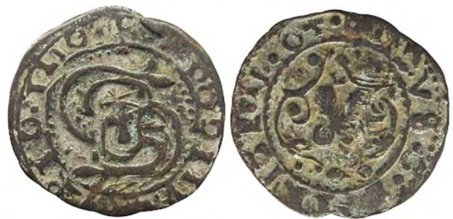
Рис. 373 Фальшивий шведський солід Сигізмунда III Ваза (1587–1632), прототип карбування монетного двору Риги. Діаметр: 17 мм; вага: 1,24 г. [...] ] OOD III- [...] ] OIO [...] ] IO [...] ] DVS-G- [...] ] IGE-II-OT- Місце знахідки: Вінницька обл., Жмеринський р-н, с. Лука-Барська. Приватна колекція (Вишгород)