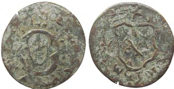
Рис. 370 Фальшивий шведський солід Сигізмунда III Ваза (1587–1632), прототип карбування монетного двору Риги. SOLID [...] ] SIP [...] ] [...] ] IGISM [...] ] X Місце знахідки: Вінницька обл., Жмеринський р-н, с. Лука-Барська. Приватна колекція (Вишгород)