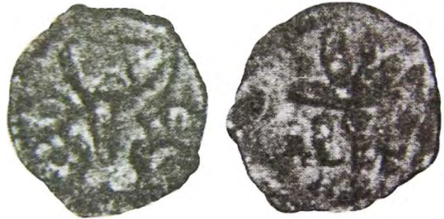
Рис. 400 Фальшивий молдавський півгрош (пуло) Олександра чел Буна (1400–1432). Місце знахідки: фортеця Аккерман (сучас. Білгород- Дністровський, Одеська область)

логічних розкопок у фортеці Аккерман (сучас. Білгород-Дністровський, Одеська область), має абсолютно імітаційний характер. Також під час археологічних досліджень у фортеці виявлено османські (зокрема й два фальшивих акчі), угорські, джучидські та монети кримських ханів династії Гіреїв [192, с. 230].