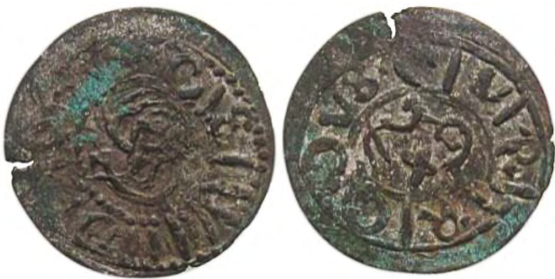
Рис. 364 Фальшивий шведський солід Сигізмунда III Ваза (1587–1632), прототип карбування монетного двору Риги. Діаметр: 15,5 мм; вага: 0,62 г. [...] [...] CIVI PO RIG DVS Приватна колекція (Вишгород)