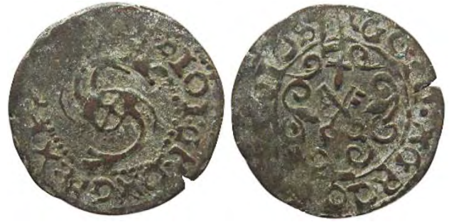
Рис. 365 Фальшивий шведський солід Сигізмунда III Ваза (1587–1632), прототип карбування монетного двору Риги. SIOI:GRDX G REX [...] RGOI G [...] [...] CIVI PO RIG DVS XRGO [...] Місце знахідки: Вінницька обл., Жмеринський р-н, с. Лука-Барська. Приватна колекція (Вишгород)