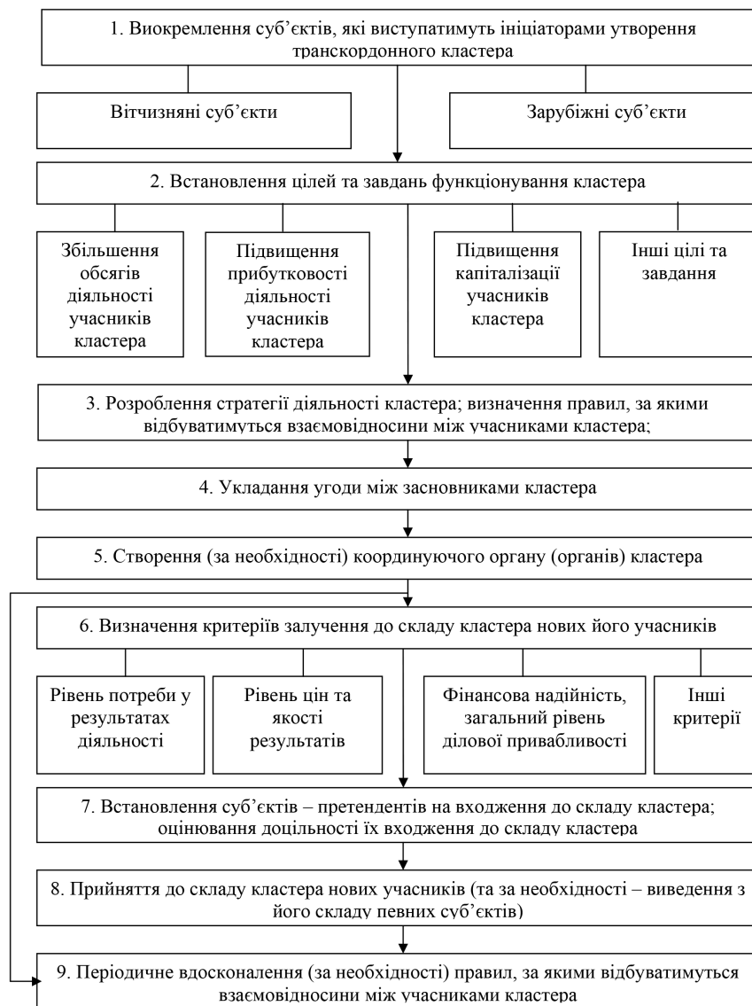
Рис. 2. Послідовність процесів формування та розвитку транскордонних кластерів у разі їх цілеспрямованого характеру [розроблено авторами]

– надання послуг, переважно консультативного, інжинірингового, страхувального та логістичного характеру, із розроблення, ухвалення та реалізації управлінських рішень з формування та розвитку економічного кластера (зокрема транскордонного).