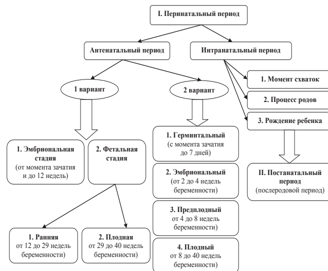
Рис. 1. Дифференциация периодов жизни человека до и после рождения

Существует четвертый вариант деления антенатального периода, который предусматривает всего лишь три стадии: предзародышевая (с момента зачатия и до двух недель беременности); эмбриональная (с третьей–восьмой недели беременности до девятой недели) и плодная (с девятой недели беременности и до момента родов).