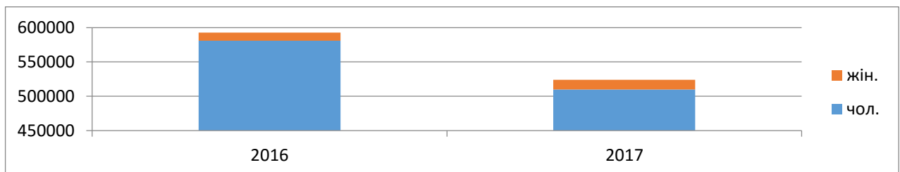
Діаграма 1. Кількість зареєстрованих кримінальних злочинів в Україні, здійснених у 2016-2017 рр.

За даними статистики Генеральної прокуратури України [1] у 2016-2017 рр. відсоток жіночої злочинності у нашому суспільстві коливався в межах 1,99-2,72% від усієї злочинності (див. діаграму 1).