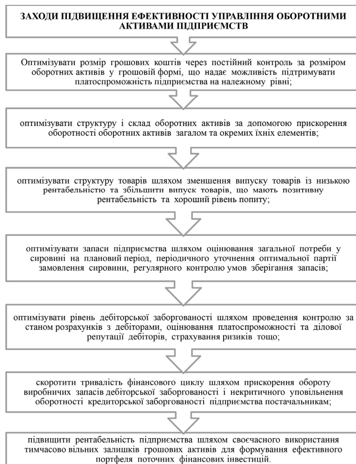
Рис. 3. Заходи із підвищення ефективності управління оборотними активами підприємств

За умови забезпечення вдалого управління оборотними активами на підприємстві вдається досягти деякого вивільнення активів, які можна застосувати для забезпечення зростання прибутковості його функціонування, пришвидшення обіговості оборотних коштів, забезпечення безперервної виробничої діяльності та максимізації прибутковості, що беззаперечно є першочерговою місією для кожного суб'єкта господарювання.