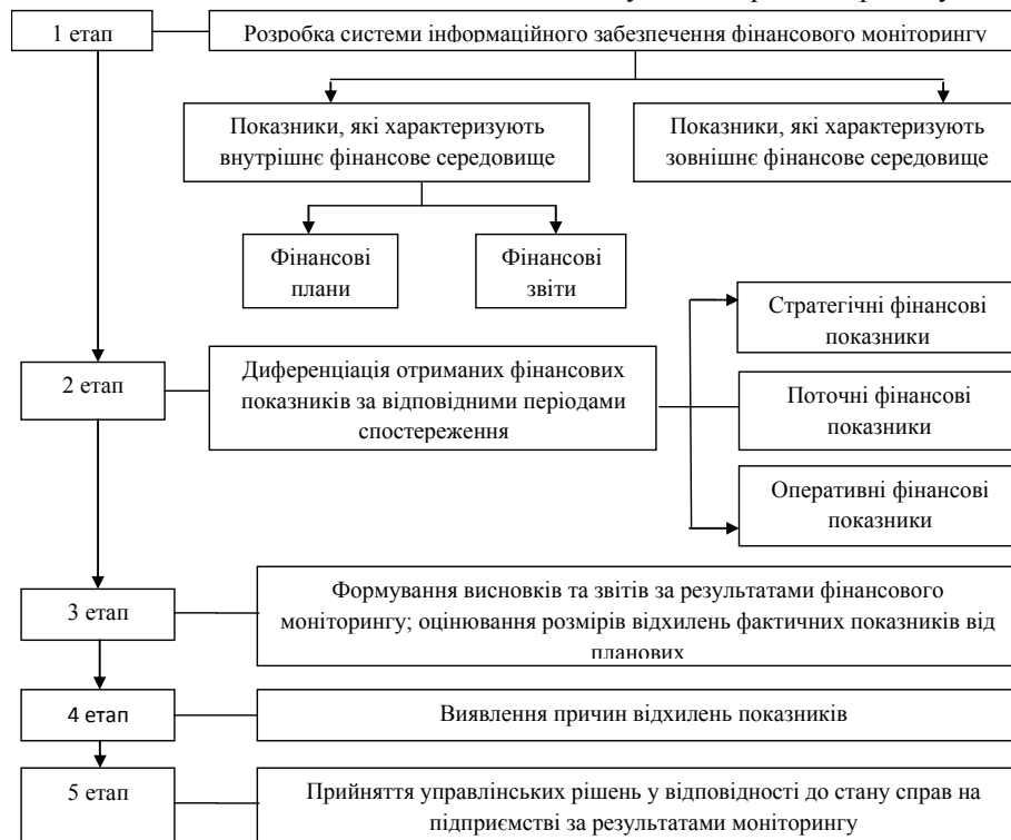
Рис. 1 Алгоритм побудови системи антикризового фінансового моніторингу на підприємстві

На рис. 1 представлено алгоритм реалізації системи антикризового фінансового моніторингу на підприємстві, який представляє послідовність виконання певних етапів.