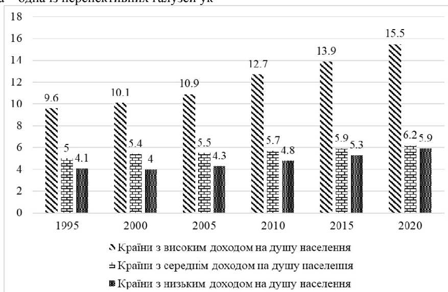
Рис. 1. Динаміка витрат на охорону здоров'я, % ВВП [розраховано на основі [10]]

Основними гравцями на українському ринку фармацевтичної продукції є національні виробники. Наведемо інформацію підприємств за обсягом аптечних продажів товарів із зазначенням їх позиції в рейтингу за період 2017–2018 рр., а також приросту продажів, Індекс еволюції (Evolution index) та частки на ринку (табл. 1).