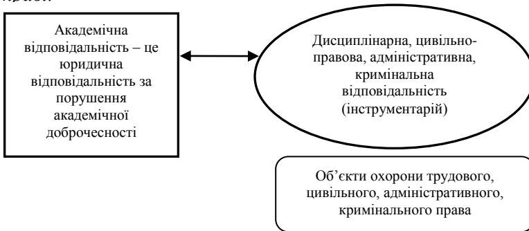
Рис. 1. Взаємозалежність змісту та об'єму поняття «академічна відповідальність» як збірного поняття і міжгалузевого інституту

Застосовуючи закон логіки «зворотного відношення між змістом та об'ємом поняття» [2] у поєднанні із методом логіко-графічного структурування до поняття «академічна відповідальність» (рис. 1, рис. 2), можна зробити висновок, що академічна відповідальність є міжгалузевим правовим інститутом, що дозволяє охопити об'єкти правової охорони у цивільному, трудовому, адміністративному та кримінальному праві.