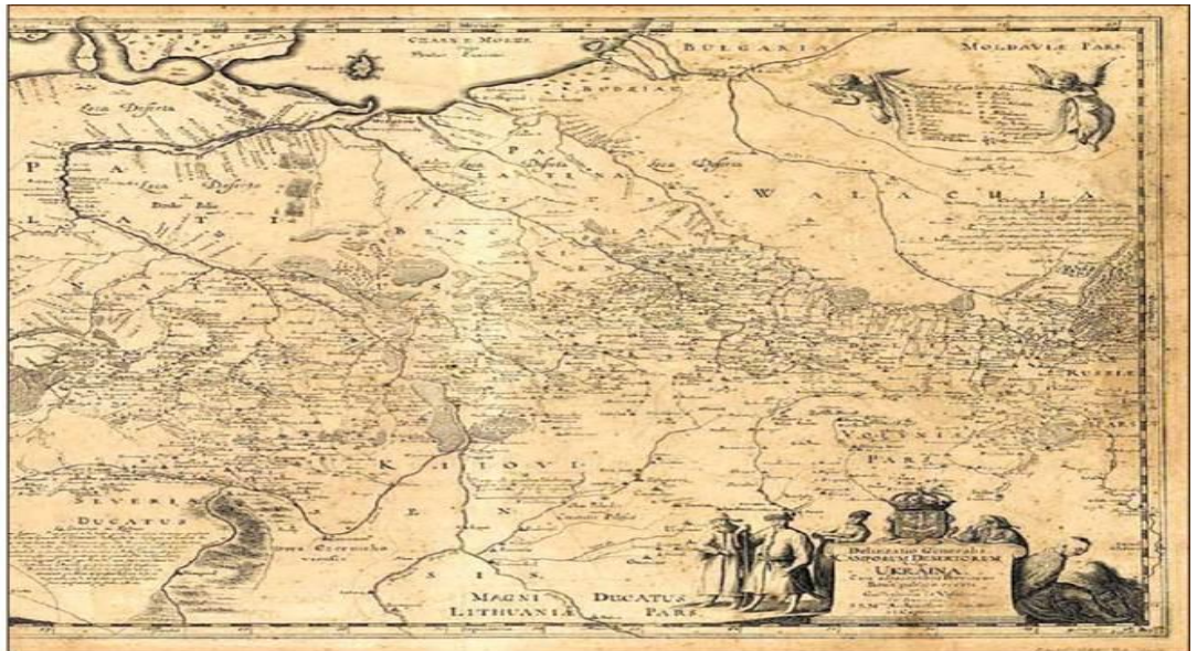
Генеральна карта України Гійома де Боплана, 1648 р.

Перше видання Генеральної карти України « Delineatio Generalis Camporum Desertorum Vulgo Ukraina » («Загальний план безлюдних земель, які зазвичай називають Україною»), південна орієнтація (південь зверху), 42×54,5 см, масштаб 1:1800000, було виконано відомим голландським гравером Вільгельмом Гондіусом і надруковано в Данцизі 1648 року. На карті відображено 1.293 об'єкти, у тому числі 993 назви населених пунктів та 153 назв річок. Протягом XVII століття та у першій половині XVIII століття карти Боплана використовувалися у європейській картографії для відображення українських земель.