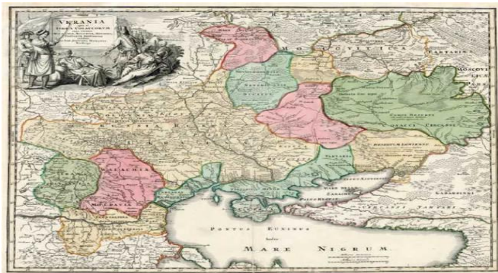
Карта «Україна – земля козаків...». Йоганн Баптист Гоманн, 1720 р.

На підставі карт де Боплана, карту України «Україна – земля козаків...» склав Йоганн-Баптист Гоманн, німецький географ та картограф, засновник картографічного видавництва у Нюрнберзі, яке було провідним видавцем карт у Німеччині 18 ст. Ця карта узагальнила всі відомі на той час знання географів та істориків про Україну. Її неодноразово перевидавали протягом 100 років, і вона стала одним із найвідоміших зображень наших територій.