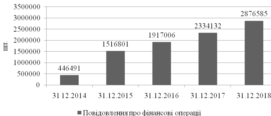
Рис. 1. Динаміка інформування про фінансові операції за період 2014-2018 рр. [1]

Згідно з рис. 3 найбільша увага та посилений моніторинг приділяється банківським фінансовим операціям. За весь досліджуваний період їх частка становила більше ніж 97%. Проте особливу увагу доцільно приділяти і фінансовим операціям страхових, дилерських, клірингових, інвестиційних та інших компаній, основна діяльність яких супроводжується фінансовими операціями. Адже, хоча банки й виступають як основна кредитна установа, що надає фінансові послуги, проте значна частина розрахунків залишається у тіні, що ігнорується фінансовим моніторингом.