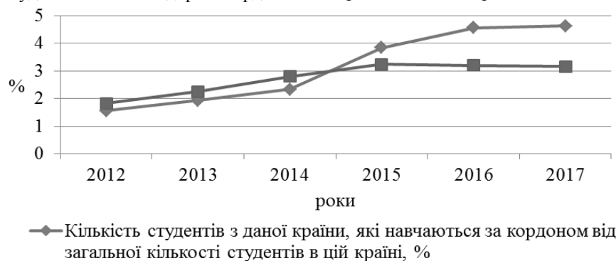
Рис. 2. Кількість студентів прибулих та вибулих з України з метою отримання освіти за 2012-2017 рр.

Цікаво проаналізувати мобільність студентів з країн пострадянського простору. До даної групи входять 3 країни, з яких Латвія на даний момент є членом Європейського Союзу. Аналіз даних табл. 2 свідчить про найбільшу кількість студентів, які навчаються за кордоном у Латвії і Білорусії близько 6,5 %. Це пояснюється тим, що для студентів з Латвії відкриті кордони