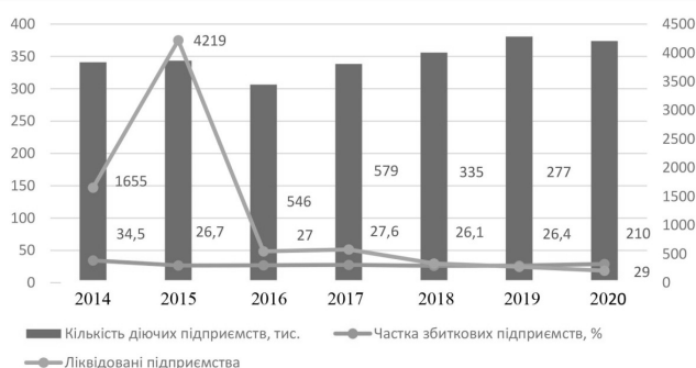
Рис. 1. Динаміка кількості діючих, частки збиткових та ліквідованих підприємств України за період 2014-2020 рр. [1]

Згідно з даними офіційного сайту Генеральної прокуратури України з 2016 р. до липня 2022 р. спостерігається тенденція до зменшення виявлення та повідомлення про доведення підприємств до банкрутства (рис. 2).