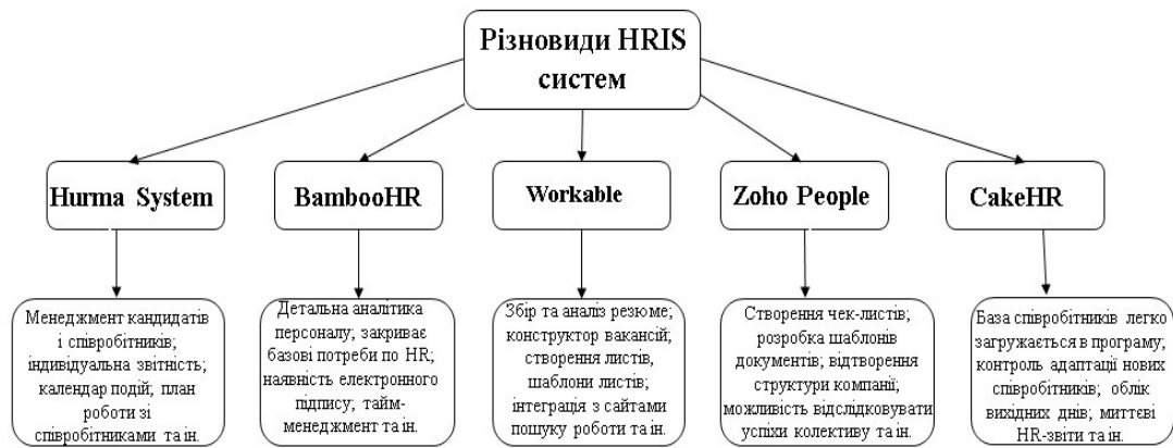
Рис. 1. Популярні види HRIS систем в Україні