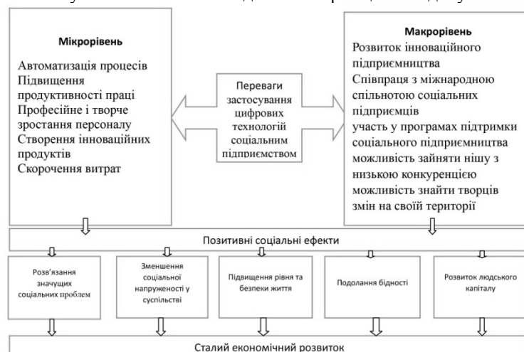
Рис. 2. Переваги застосування цифрових технологій в роботі соціальних підприємств (розроблено авторами)