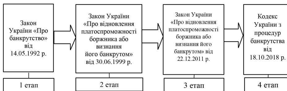
Рис. 2. Етапи становлення та розвитку національного законодавства про банкрутство [розроблено авторами за даними Офіційного вебпорталу парламенту України]

Наявність прогалин, величезна кількість нормативно-правових актів прийнятих безсистемно, низька їх якість та інколи суперечливість, з одного боку, а також важливість та складність відносин у даній сфері – з іншого, зумовили необхідність реформування законодавства у сфері регулювання банкрутства [8].