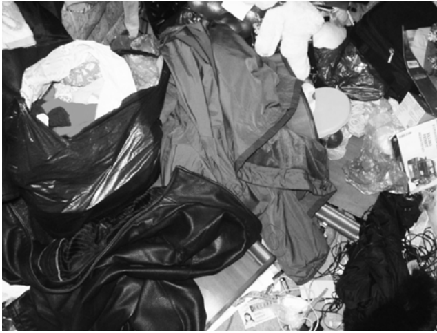
Рис. 3. Речі в хаотичному стані на підлозі кімнати (стрілками позначено пошкоджені меблеві фасади, які знаходилися під одягом та речами зі слідами взуття потерпілої)