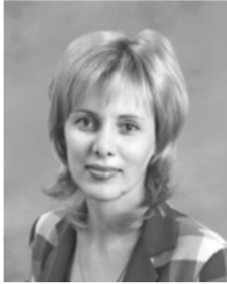
старший викладач, Одеський національний університет імені І.І. Мечникова