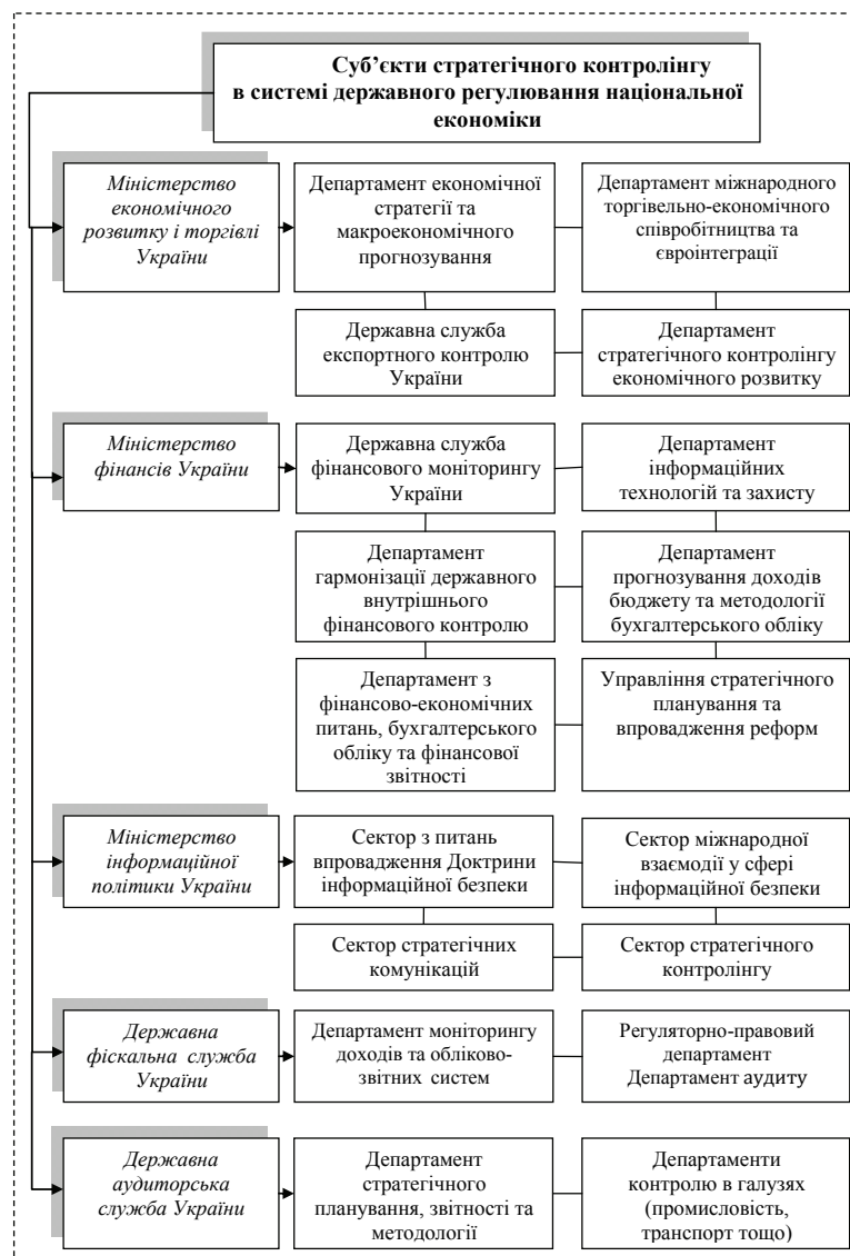
Рис. 2. Суб'єкти стратегічного контролінгу в системі державного регулювання національної економіки