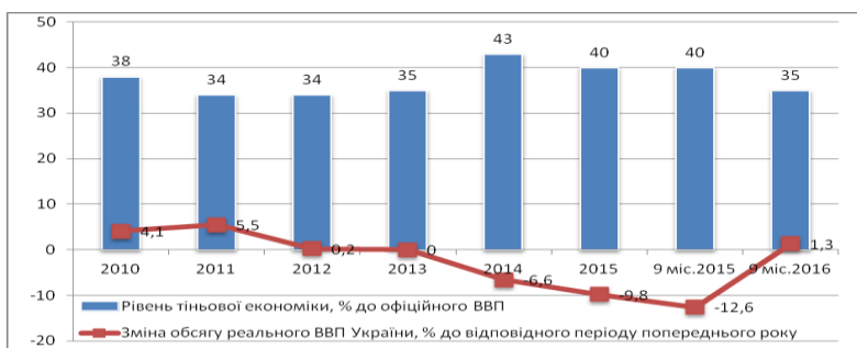
Рис. 1. Інтегральний показник рівня тіньової економіки в Україні (у % від обсягу офіційного ВВП)

За розрахунками Мінекономрозвитку у січні-вересні 2016 р. рівень тіньової економіки становив 35 % від офіційного ВВП, що на 5 % менше у порівнянні з показником відповідного періоду 2015 р. (рис. 1) [3].