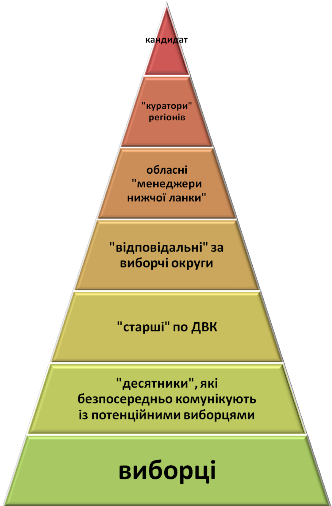
Схема організації виборчої «піраміди»