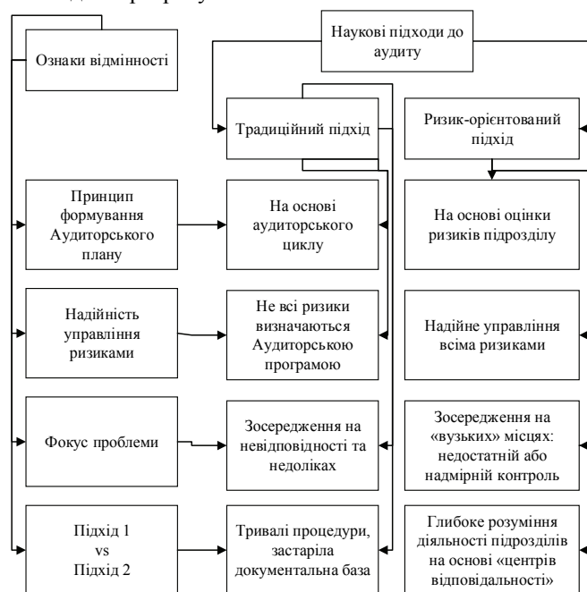
Рис. 1. Відмінності між традиційним та ризик-орієнтованим підходами внутрішнього аудиту на підприємствах [систематизовано авторами]

Персонал підприємства – це внутрішні стейкхолдери різних кіл впливу на ризики підприємства. З метою оцінювання внутрішніх груп ризиків можна використати інструмент побудови карти ризиків у двофакторній площині «вплив – зацікавленість» відповідно до вимог організаційної структури підприємства. В якості прикладу наведемо Карту ризиків фінансового департаменту (рис. 2).