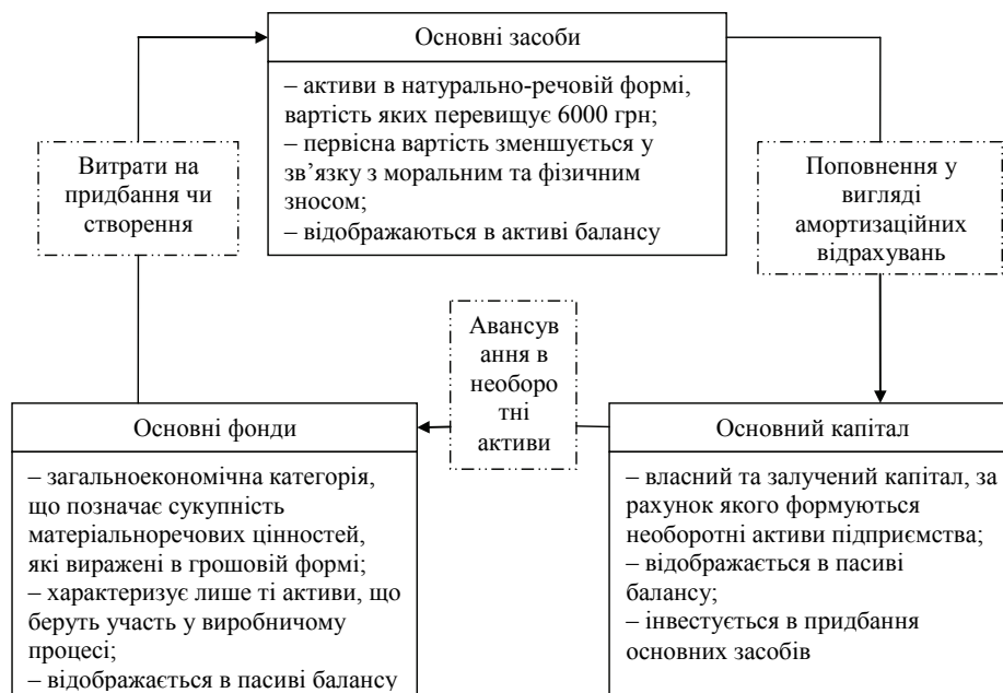
Рис. 1. Відмінності між категоріями «основні фонди», «основний капітал», «основні засоби» та їх взаємодія у виробничому процесі [розроблено автором на підставі [3], [12]]

На рис. 2 наведено типову класифікацію основних фондів промислового підприємства.