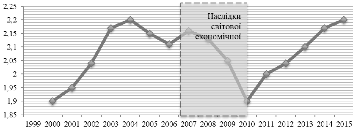
Рис. 3. Динаміка індексу міграційної привабливості країн ЄС [складено автором]