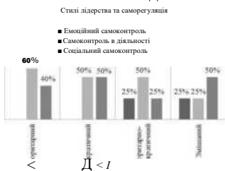
Рис. 1. Дані про стилі лідерства та види саморегуляції студентів

стилями лідерства. Загальний ступінь вираженості схильності до лідерства. Студенти з авторитарним, авторитарно-демократичним, змішаним мають однаковий рівень загального самоконтролю (рис. 2).