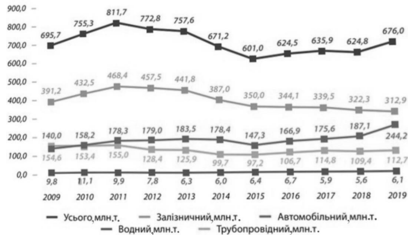
Рис. 1. Обсяг перевезень вантажів різними видами транспорту за 2009-2019 рр. [6]

Можна відзначити тенденцію, що протягом останнього десятиліття обсяг перевезених усіма видами транспорту вантажів коливався у межах від 601 до майже 812 млн т., досягнувши рекорду в 2011 р., найнижчого значення у 2015 р. – 601 млн т. Можна зробити висновок, що найбільші обсяги перевезень здійснює саме залізничний, навіть з урахуванням зниження обсягів з пікових 468 млн т. у 2011 р. до мінімального значення 312,9 млн т. у 2019 р. Інші види транспорту виявили відносну стабільність, що корелюється із загальними річними показниками.