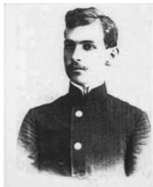
Георгій Михайлович Рудий (1863–1918)

Разом із сищиками Георгій Михайлович дістався місця події. Після його ретельного огляду він розпитав Падалку і Смоловика про обставини виявлення трупа Ющинського. Рудого особливо цікавило, чи не знайдено біля трупа слідів крові. Заналізувавши отриману інформацію, він висловив думку, що хлопчика вбили в іншому місці, а потім уже перенесли до печери. І додав, що причи-