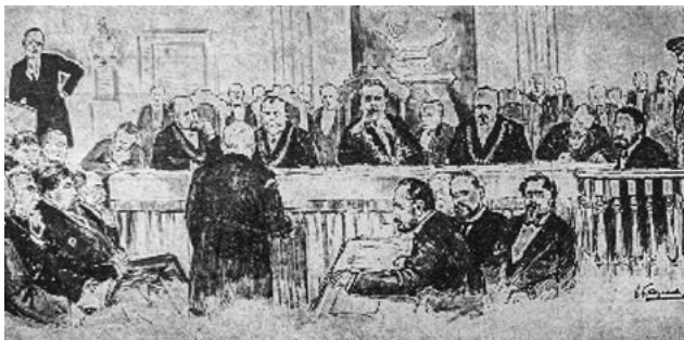
Загальна картина засідання суду у «справі Бейліса»