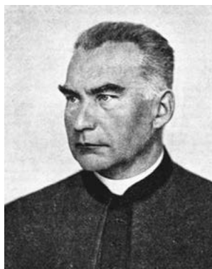
Ксьондз канонік Джастін Пранайтіс (1861–1917)

Ритуальна експертиза стала найбільш неоднозначною і такою, що привернула увагу майже всіх, хто цікавився цією справою. На попередньому слідстві «богословське» дослідження проводив ксьондз канонік Джастін Пранайтіс (1861–1917), він же виступав у суді і був допитаний сторонами процесу.