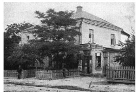
Будинок родини Чеберяк

Надалі Міщук спрямував розшук у кількох напрямках, не відкидаючи й можливості вбивства на ритуальному підґрунті. Проте невдовзі переконався, що вбивство Ющинського вчинили кримінальні злочинці. За допомогою негласних розшукових дій Міщук вийшов на знайому сім'ю Приходьків – утримувачку злодійського притону Віру Чеберяк і вирішив її заарештувати, але викликав цим незадоволення прокурора Чаплинського.