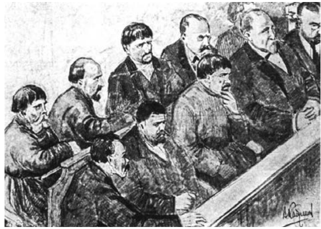
Зображення роботи присяжних у «справі Бейліса»

Такий вирок не задовольнив повною мірою жодну зі сторін процесу.