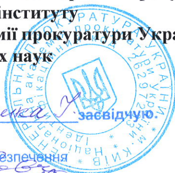
І. В. Пилипенко