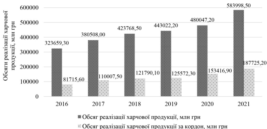
Рис. 2. Обсяги реалізації харчової продукції протягом 2016-2021 рр. [розроблено авторами на основі [2]]