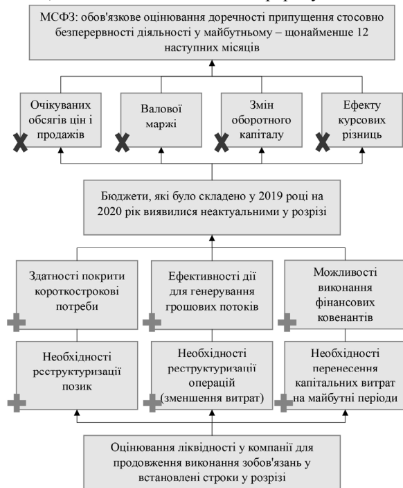
Рис. 1. Оцінювання безперервності діяльності в умовах пандемії [на основі [1; 2]]

Підприємства мають зазначати у своїй звітності значну невизначеність, причини якої – у подіях та обставинах, що здатні справити настільки негативний вплив на діяльність підприємств, що безперервна діяльність буде неможливою. Також необхідно розкривати інформацію коли менеджмент приймає рішення, що суттєва невизначеність відсутня в тому, що дане рішення базується на достатніх для таких суджень даних: опис обставин і фактів, які створюють суттєву невизначеність, а також заходи, що вживаються менеджментом, щоб забезпечити безперервну діяльність.