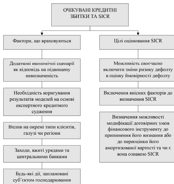
Рис. 3. Оцінювання очікуваних кредитних збитків [на основі [1; 2]]

Даний індекс є дуже показовим у контексті масштабів впливу пандемії на підприємства всіх галузей. Можна припустити, що глобальний індекс ділової активності може бути дзеркальним відображенням динаміки SICR – під час суттєвого падіння ділової активності може відбуватись суттєве зростання кредитного ризику.