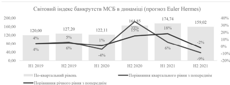
Рис. 5. Рівень (%) та індекс банкрутств МСБ, включаючи прогноз [10]