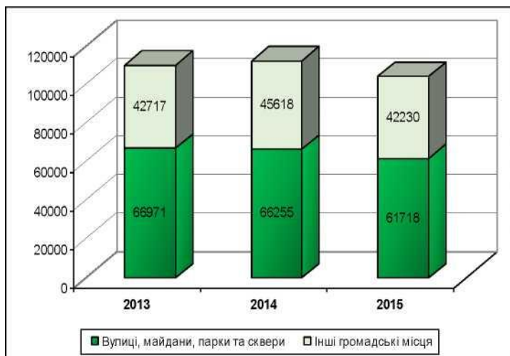
Рис.1. Злочинність у громадських місцях

У 2015 р. при зростанні загального числа облікованих злочинів відбулося зменшення кількості посягань, вчинених у громадських місцях, а також їх видів. Загальна кількість таких посягань дорівнювала 103948 (-7,1%), злочинів, вчинених на вулицях (дорогах), площах, у парках, скверах - 61718 (-6,8%), в інших громадських місцях (на вокзалах, в аеропортах, магазинах, кафе, барах, ресторанах тощо) - 42230 (-7,4%) (рис. 1). Відповідно до такої динаміки частка діянь цієї категорії серед всіх злочинів зменшилася до 18,4% (2013 р. - 19,5%, 2014 р. - 21,1%).