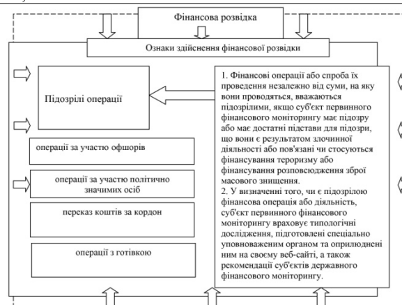
Рис. 1. Основні ознаки і передумови проведення фінансової розвідки