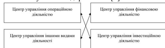
Рис. 3. Дія принципу взаємозалежної діяльності функціональних центрів управління

Згідно з другим підходом (рис. 3) функціональні центри управління будуються на основі принципів взаємопов'язаної діяльності, за якого більшість управлінських рішень в межах конкретної функції управління приймаються ними самостійно, а низка управлінських рішень, які вимагають комплексного розроблення, ухвалюються спільно з іншими функціональними службами підприємства [8].