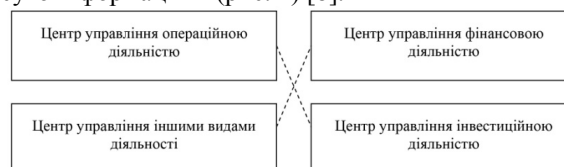
Рис. 2. Дія принципу незалежної діяльності функціональних центрів управління

Згідно з першим підходом управлінські функціональні центри будуються на принципах незалежності, а їхні зв'язки з іншими функціональними підрозділами – суто інформаційні (рис. 2) [8].