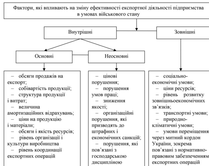
Рис. 4. Фактори, які впливають на зміну ефективності експортної діяльності підприємства в умовах військового стану [побудовано авторами]

В сучасних умовах військового стану застосування різних форм управління обумовлюється специфічними рисами господарської діяльності підприємства та його стратегією, відповідно, модель організації експортної діяльності для різних підприємств однозначно буде різною, що свідчить про наявну можливість застосування підприємствами різних стратегій управління експортною діяльністю, від результатів реалізації яких залежить і сам рівень її ефективності. Всю сукупність таких моделей можна згрупувати та виділити таку їх типологію: