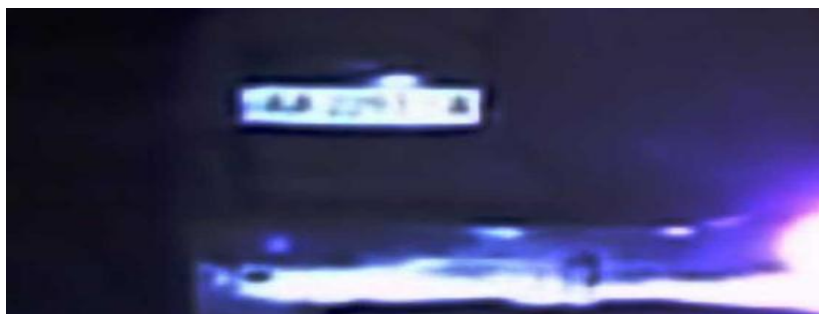
Мал. 2. Результат зображення після адаптованої обробки зображень

Тому ідентифікація номерного знаку транспортного засобу проводилася в декілька етапів. З цією метою з відео було виділено 60 окремих зображень та об'єднано в зображення, використовуючи обробку зображень із суперпоглинанням.