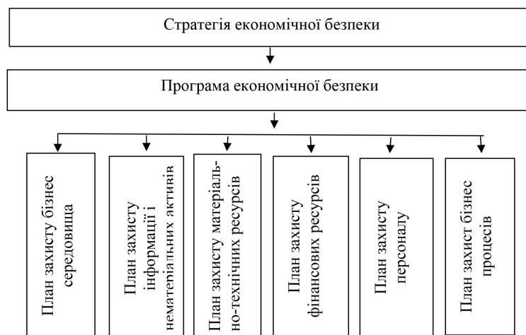
Рис. 1. Система планів економічної безпеки підприємства

З урахуванням вищевикладеного, схема взаємозв'язку стратегії, програми та планів економічної безпеки підприємства матиме наступний вигляд (рис. 1).