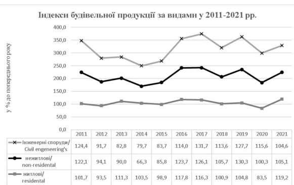
Рис. 1. Динаміка показників роботи галузі 2011 – 2022 рр. (складено автором на основі [5])

У дослідженні будівельного ринку України варто відмітити загальне зростання вартості будівельно-монтажних робіт. Очевидною у подібному детальному дослідженні є сезонність ринку та вплив на його зміну використання новітніх технологій в будівельній галузі України. На означені показники істотно впливають також інфляційні процеси та сезонна інфляція в країні. Варто відмітити, що тенденції зростання цін у будівельній галузі відображають більшою мірою загальний стан розвитку економіки та стабільність гривни.