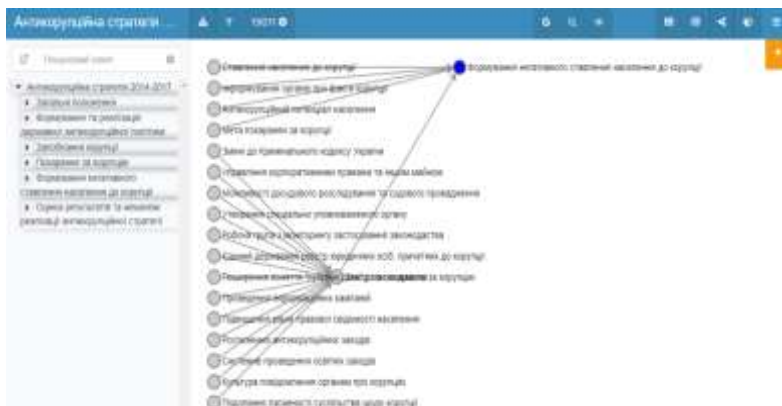
Рис. 3. Фрагмент онтографу, побудованого Когнітивною ІТ-платформою «ПОЛІЕДР» на тексті Закону України «Про засади державної антикорупційної політики в Україні (Антикорупційна стратегія) на 2014–2017 роки» від 14 жовтня 2014 року № 1699-VII.

У такий спосіб онтологічне моделювання дозволяє оцінити повноту опису понятійної системи будь-якої досліджуваної предметної області.