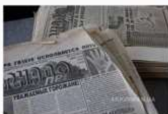
Примірники ЗМІ Білгород-Дністровського району та міста

У Білгород-Дністровському районі та місті Білгород-Дністровський Одеської області діють такі ЗМІ: канал «Перший муніципальний», служба новин «Наше місто», газета «Горнадо», газета «Слово Придністровья» (рос. мова). Проаналізувавши дані масмедіа, дійшли висновку, що в них використовується як українська, так і російська мови, інколи з порушенням мовних норм, зокрема лексичних, акцентуаційних, орфоепічних та граматичних.