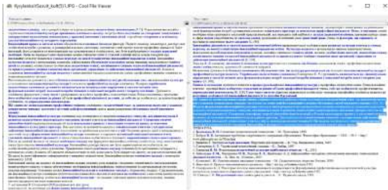
Рис. 2. Екранна форма САТ з експлікованим фрагментом еталонного тексту (ліва частина поля), відтвореного в аналізованому (права частина поля) без посилання на джерело.

Результат порівняння аналізованого тексту (позначено цифрою 1) із трьома еталонними (позначено цифрами 2; 3; 4 відповідно) за трійками слів (триграмами) (цифра 3 під елементом «Документи користувача» в командному рядку). Як видно з наведеної Форми, в аналізованому тексті є запозичення з тексту № 4 (19,67 % збіг за триграмами). У повнотекстовому режимі САТ виділяє блакитним кольором шрифту спільні слова та «підсвічує» маркером фрагменти, що досимвольно збігаються. Оскільки аналізований текст не містить оформлених посилань на Джерело № 4, такий збіг було кваліфіковано як недоброчесне запозичення (плагіат). (див. Рис. 2).