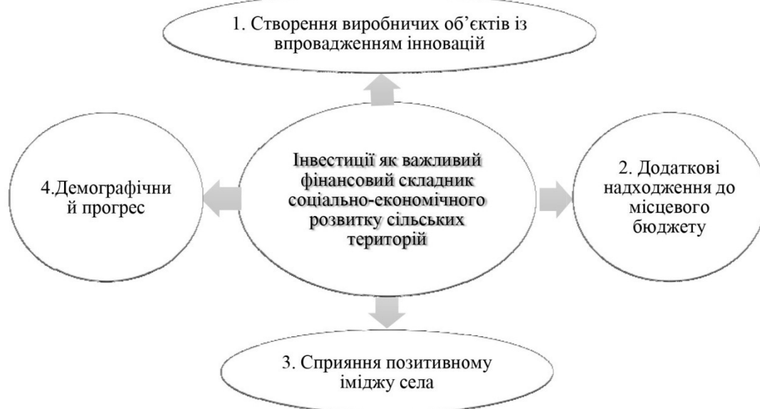
Рис. 2. Роль інвестицій в інноваційному розвитку сільських територій

Проаналізувавши рис. 2, можемо чітко розуміти вплив інвестицій на розвиток сільських територій та прогнозувати позитивні результати привабливого інвестиційного клімату й необхідності стратегії реалізації такого клімату. Адже інвестиції стимулюють розвиток виробничих об'єктів на місцях, що додає додатковий дохід у місцеві бюджети, що зі свого боку сприяє позитивному іміджу села та демографічному прогресу. Тому можемо зробити висновок, що інвестиції являються необхідною важливою складовою інноваційного розвитку сільських територій України.